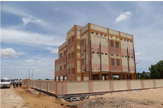
प्रकाशम जिला (आंध्र प्रदेश) के वुलवापाडु मण्डल में चक्कीचेरला एस.टी. कॉलोनी में एम.पी.सी.एस.