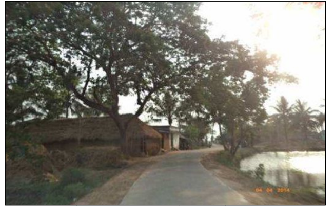
शंखपुर, केंद्रपाड़ा जिला, ओडिशा में संपर्क सड़क