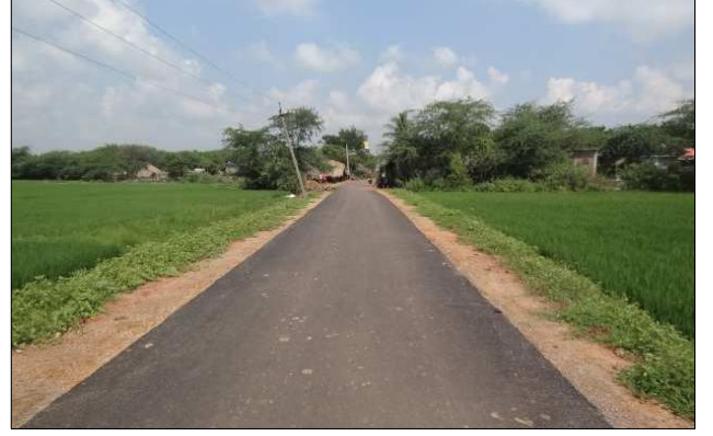
कृष्णा जिला (आंध्र प्रदेश) में पेडागुडुमोटु में बहु-उद्देशीय चक्रवात आश्रय-केंद्र