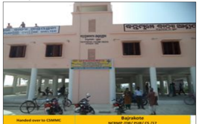
पुरी जिला, ओडिशा में बाजारकोटा में बहु-उद्देशीय चक्रवात आश्रय-केंद्र