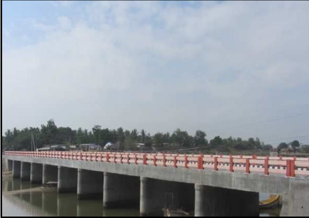
गुंटूर जिला (आंध्र प्रदेश) में बपटला पांडुरंगपुरम के 2/4 कि.मी. में पुल

4.4 इस घटक में चक्रवात जोखिम प्रशमन ढांचा जैसे बहु-उद्देशीय चक्रवात आश्रय-केन्द्र (एम.पी.सी.एस.), आश्रय-केंद्रों और आवासों, पुलों और लवणीय तटबंधों तक संपर्क सड़कों, को खड़ा करना है। कुल 292 एम.पी.सी.एस. में से, 160 एम.पी.सी.एस. का काम पूरा हो गया है: 539 (782.4 किलोमीटर) सड़कों में से, 474 (663.9 किलोमीटर) सड़कों का काम पूरा हो गया है: 23 पुलों में से, 12 पुलों का काम पूरा हो गया है: 14 (90.96 किलोमीटर) लवणीय तटबंधों पर काम प्रगति के अंतर्गत है।