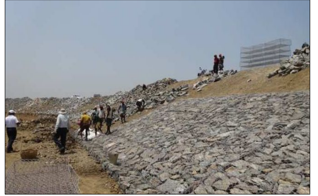
राजनगर-गोपालपुर लवणीय तटबंध (सड़क 15.05 से 19.05 कि.मी.) गंजम जिला, ओडिशा